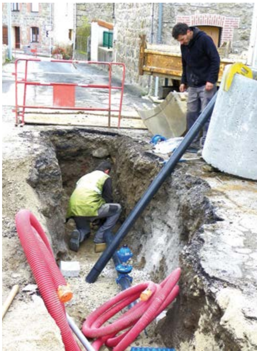
Travaux de mise en séparatif et enfouissement

C'est l'entreprise BROCC qui a posé sur la Rue centrale, un revêtement en bicouche provisoire.