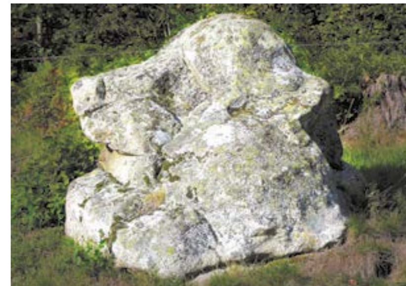
Debout le chien !