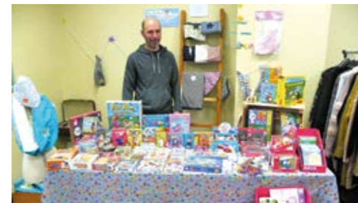
Jeux et jouets de Au bonheur des Matrus