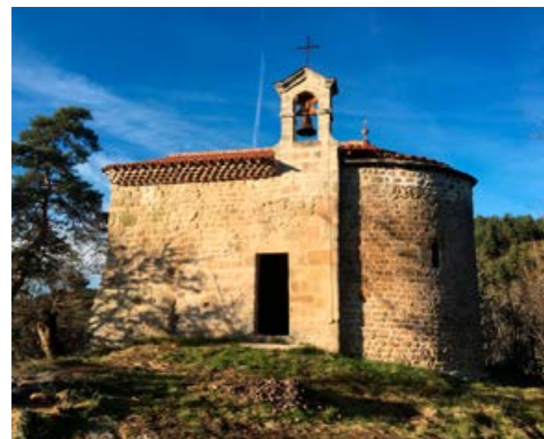
Elle est mise en valeur notre Chapelle

Pendant longtemps, la chapelle servit de lieu de culte aux hameaux dispersés à l'entour, de part et d'autre de la Dunière.