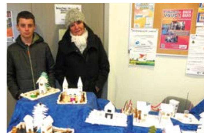
Vente de décors de tables de Noël pour financer un voyage pédagogique