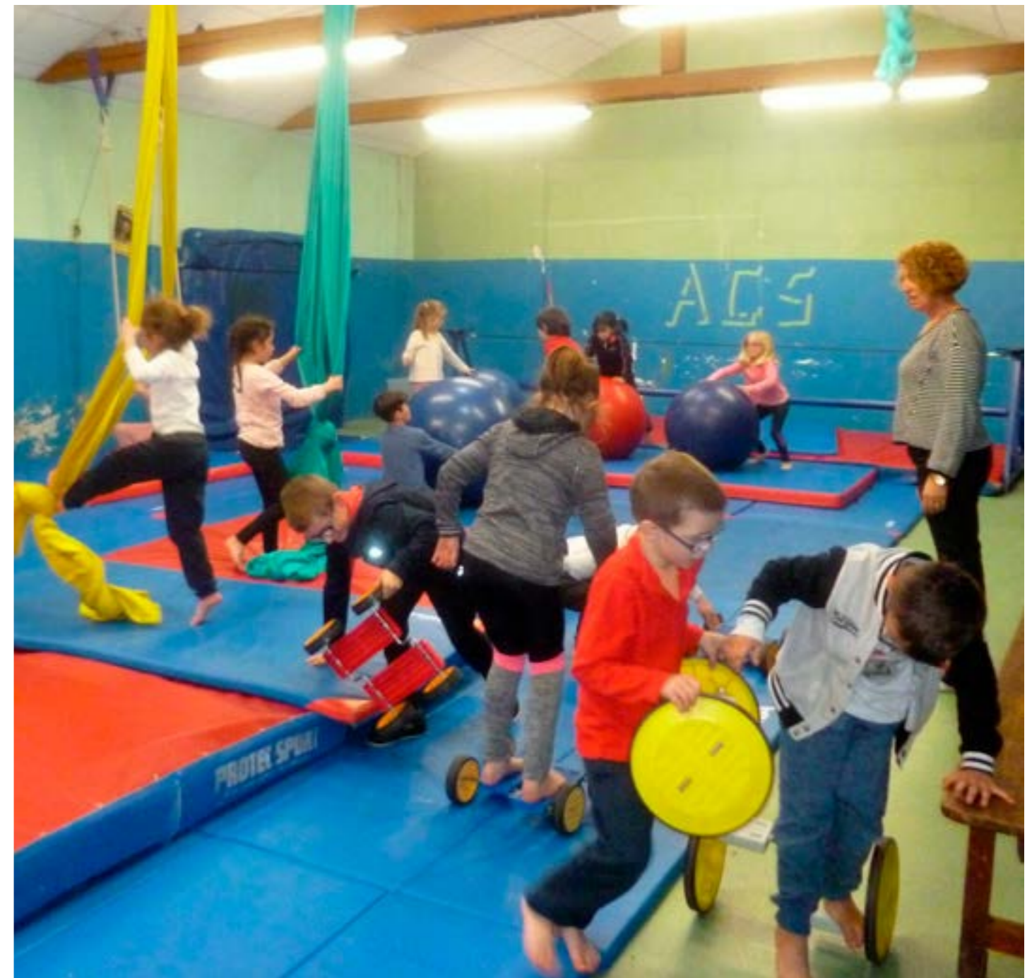
L'école du cirque

C'est une expérience exceptionnelle que les enfants adorent.