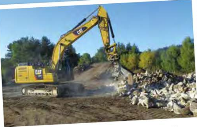
Le concassage des pierres présentes au Rouge

Nous comptons sur le civisme de ceux pour qui l'accès (motos, quads) est interdit, pour pouvoir, ainsi, préserver de tout acte de détérioration ce lieu public et bien commun.