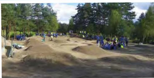
Le circuit en fin de journée