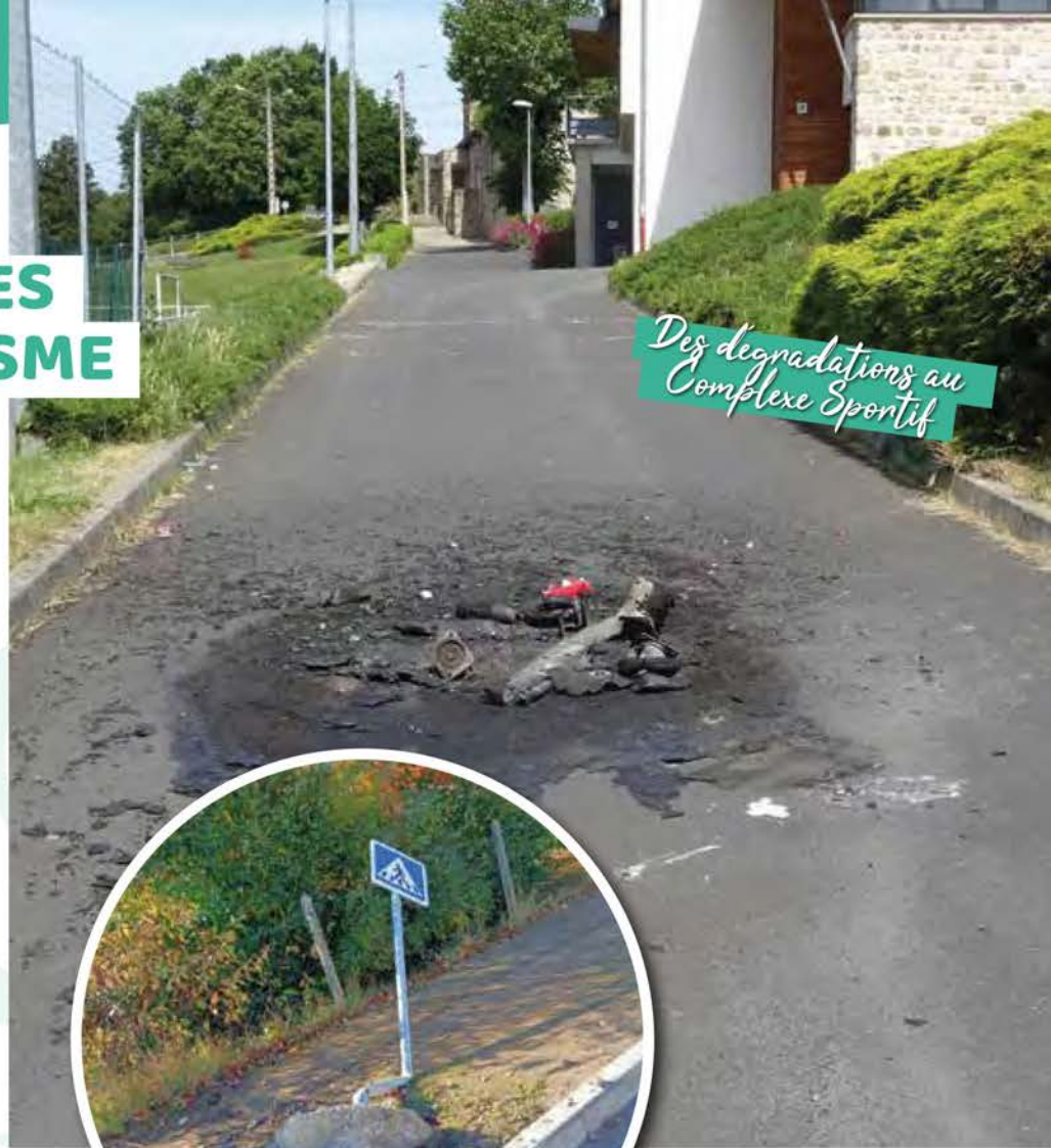
Des dégradations au Complexe Sportif

Ces comportements de non respect de l'espace et des biens publics sont regrettables et nuisent au bien vivre ensemble par les dangers qu'ils peuvent représenter, l'aspect désagréable qu'ils créent et l'attitude non écologique qu'ils traduisent. Notre volonté est que des espaces comme le stade, le parc Sarrand et l'espace « circuit vélo » récemment aménagé au Rouge demeurent libres d'accès afin de favoriser la socialisation, les rencontres et les temps de partages amicaux et familiaux. Ce message a un objectif de prévention et de sensibilisation, nous demandons à chacun : élus, parents, enfants/ados/jeunes adultes, citoyens, de le prendre en compte, nous avons tous un rôle à jouer.