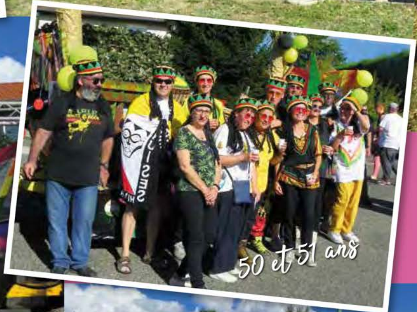
50 et 51 ans