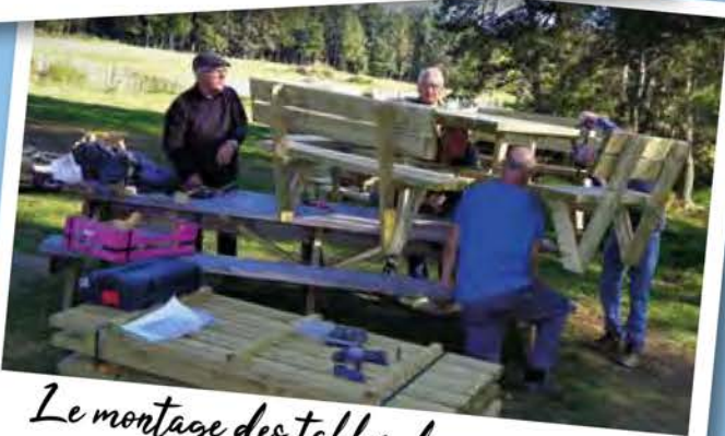
Le montage des tables de pique-nique par quelques bénévoles