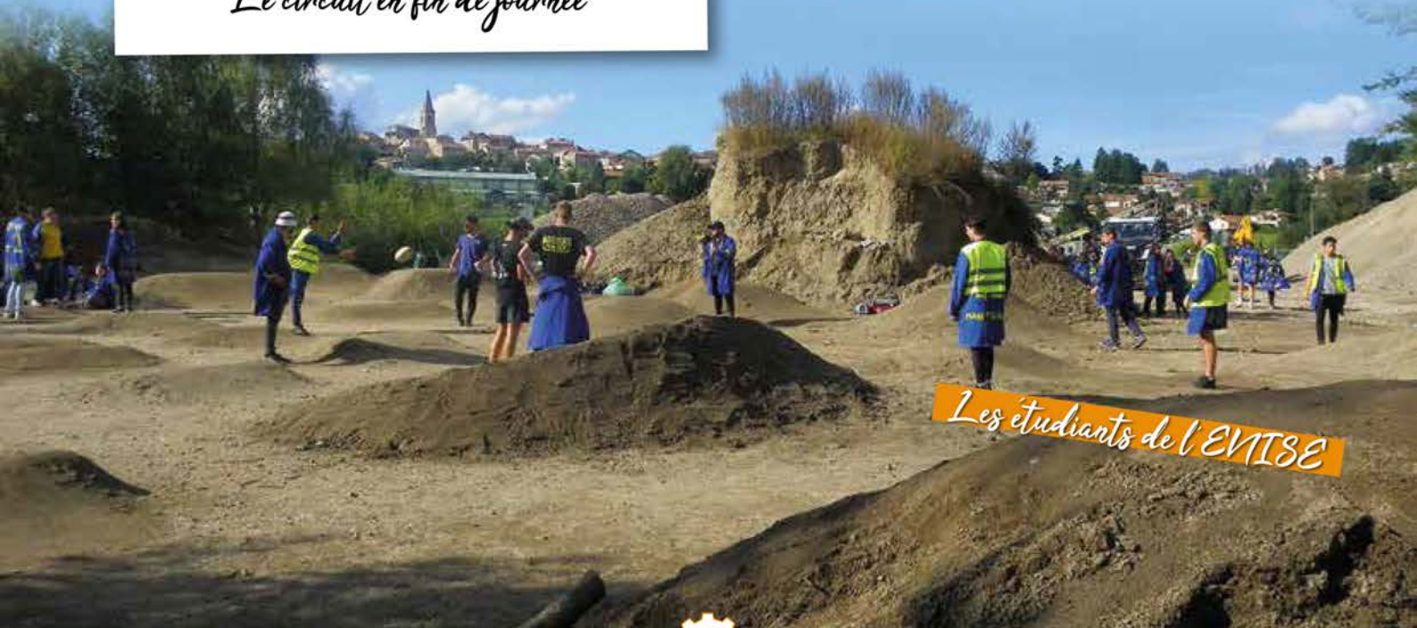
Les étudiants de l'ENISE