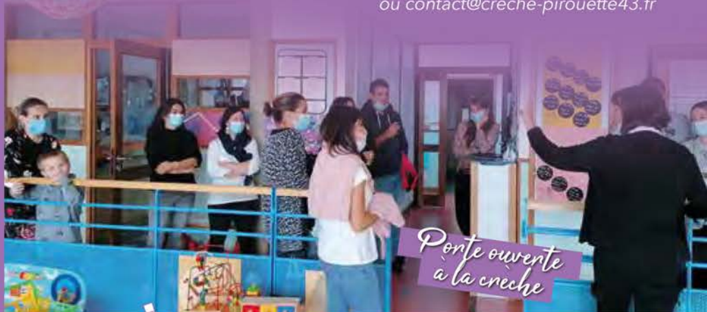
Porte ouverte à la crèche

Une porte ouverte a eu lieu le 2 Octobre où nous avons pu partager avec les familles et présenter notre bel épouvantail, « dame nature », qui a remporté le premier prix au Marché aux Paniers.