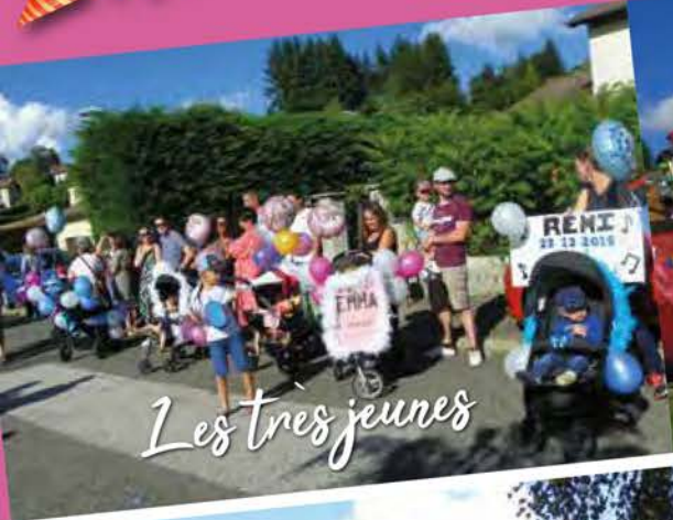
Les très jeunes