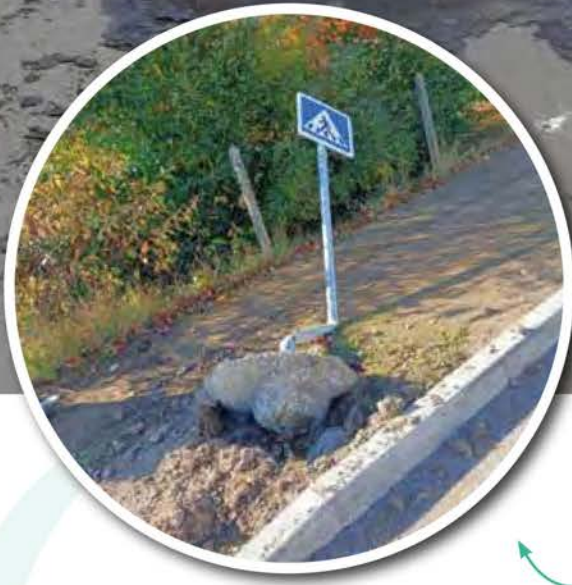
Un exemple de panneau arraché à Lichemialle